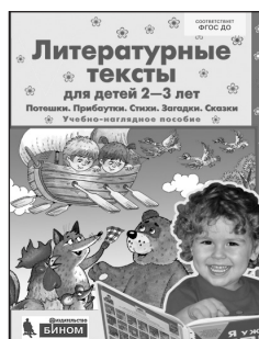
«Литературные тексты для детей 2–3 лет». Учебно-наглядное пособие