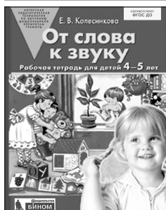
«От слова к звуку». Рабочая тетрадь для детей 4–5 лет