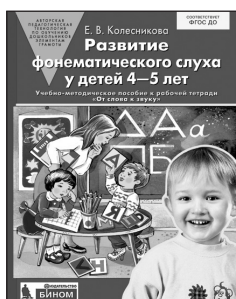
«Развитие фонематического слуха у детей 4–5 лет». Учебно-методическое пособие