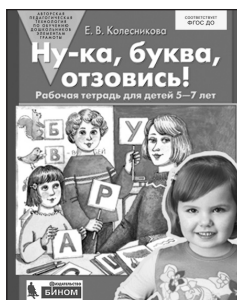
«Ну-ка, буква, отзовись!» Рабочая тетрадь для детей 5–7 лет