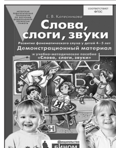
«Слова, слоги, звуки». Демонстрационный материал для занятий с детьми 4–5 лет