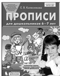
«Прописы для дошкольников 6–7 лет»