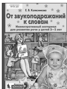
«От звукоподражаний к словам». Иллюстративный материал для развития речи у детей 2–3 лет