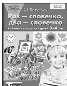
«Раз — словечко, два — словечко». Рабочая тетрадь для детей 3–4 лет