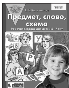
«Предмет, слово, схема». Рабочая тетрадь для детей 5–7 лет