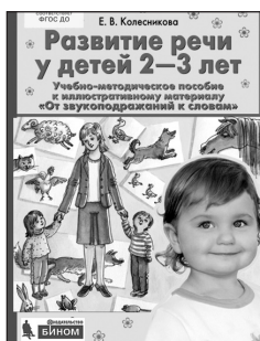
«Развитие речи у детей 2–3 лет». Учебно-методическое пособие к иллюстративному материалу «От звукоподражаний к словам»