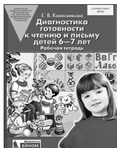
«Диагностика готовности к чтению и письму детей 6–7 лет». Рабочая тетрадь