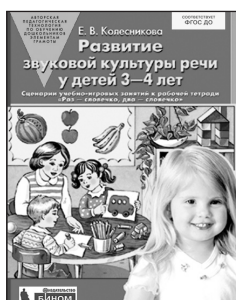
«Развитие звуковой культуры речи у детей 3–4 лет». Учебно-методическое пособие